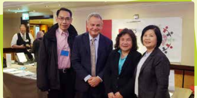
การประชุม World Standard-setters Conference 2018

ปิดท้ายการอบรมด้วยการจัดงานสังสรรค์ร่วมทานอาหารกับผู้บริหารระดับสูงและเพื่อน CFO ร่วมวิชาชีพซึ่งเพิ่มความประทับใจ สภาวิชาชีพบัญชีขอขอบพระคุณคณะวิทยากรและผู้เข้าร่วมอบรมทุกท่านมา ณ โอกาสนี้ สอบถามข่าวสารการเปิดรับสมัครรุ่นต่อไปได้ในเว็บไซต์สภาวิชาชีพบัญชี