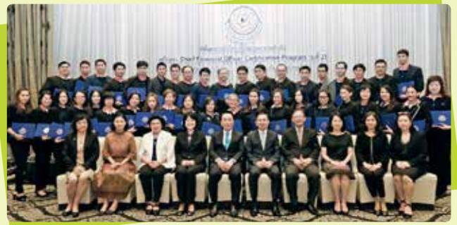
หลักสูตรคุณภาพสำหรับผู้บริหารแห่งปี “CFO Certification Program” รุ่นที่ 21

สภาวิชาชีพบัญชี โดยคณะกรรมการวิชาชีพบัญชี ด้านการบัญชีบริหาร จัดหลักสูตรคุณภาพสำหรับผู้บริหารแห่งปี “CFO Certification Program” รุ่นที่ 21 เมื่อวันที่ 17 สิงหาคม 2561 ถึงวันที่ 28 กันยายน 2561 หลักสูตรนี้ จัดขึ้นเพื่อเสริมบทบาทและความเป็นมืออาชีพด้านการบริหารการเงินและบัญชีสำหรับองค์กร โดยคัดสรรทุกเรื่องที่สำคัญสำหรับ CFO เพื่อพร้อมรับความก้าวหน้าและทุกการเปลี่ยนแปลงในอนาคต จากวิทยากรที่เป็นผู้บริหารระดับสูงและผู้ทรงคุณวุฒิในแวดวงธุรกิจและวิชาชีพบัญชี