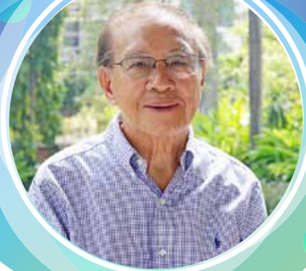
ศาสตราจารย์หิรัญ รัตศิริ

ผมรู้สึกเป็นเกียรติและมีความยินดีที่สภาวิชาชีพบัญชี ครอบรอบ 14 ปี ถ้าเราพูดถึงสถาบันวิชาชีพบัญชีเราต้องมองย้อนหลังกลับไปตั้งแต่สมัยที่เรายังเป็นสมาคมนักบัญชีและผู้สอบบัญชีรับอนุญาตแห่งประเทศไทย ซึ่งจัดตั้งขึ้นเมื่อปี 2491 จนถึงปัจจุบันนี้ ก็เป็นเวลากว่า 70 ปีแล้ว จะเห็นได้ว่าเราก็มีผลงานออกไปมากมาย และมีส่วนสำคัญในการช่วยสนับสนุนตลาดทุน ตลาดเงิน รวมถึงไปถึงการสร้างเชื่อมั่นให้กับหน่วยงานกำกับดูแล และผู้มีส่วนได้เสียทุกภาคส่วน ในโอกาสที่สภาวิชาชีพบัญชีครบรอบ 14 ปี ผมในฐานะที่เคยเป็นอดีตนายกสมาคมฯ และก็ได้มีโอกาสมาเป็นที่ปรึกษา ขอถือโอกาสนี้อาราธนาคุณพระศรีรัตนตรัยและสิ่งศักดิ์สิทธิ์ทั้งหลายที่แต่ละท่านเคารพนับถือ ขอให้ช่วยดลบันดาลคุ้มครองให้สถาบันเราและสมาชิกทุกคนของสภาวิชาชีพบัญชี มีความเจริญรุ่งเรืองก้าวหน้าในการประกอบวิชาชีพ ให้สภาวิชาชีพบัญชีของเรา ยั่งยืนตลอดไป และให้ดำเนินงานได้อย่างบรรลุเป้าหมายตามวัตถุประสงค์ที่ตั้งไว้ นอกจากนี้ยังถือโอกาสนี้ขอให้คณะกรรมการและพนักงานทุกคนของสภาวิชาชีพบัญชีที่ถือเป็นกำลังสำคัญมีความสุข ความสำเร็จสมความปรารถนาทุกประการ