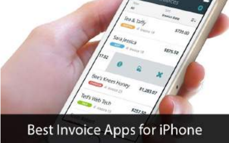
Best Invoice Apps for iPhone

สมัยก่อนกิจการที่มีการขายส่งสินค้าไปต่างจังหวัด ทุกต้นเดือนพนักงานขายต้องมาเบิกอินวอยซ์ที่ยังไม่ได้ชำระ ถี้อออกไปเพื่อเยี่ยมเยียนและเก็บเงินที่ถึงกำหนดชำระเงิน เมื่อกลับมาจะมาเคลียบัญชีว่ามีอินวอยซ์ที่ยังไม่ได้ชำระเหลืออีกใบ ส่วนต่างคือเงินที่ลูกค้าชำระมาเป็นเช็คหรือเงินสด แต่ทุกวันนี้ถ้าพนักงานขายไปถึงร้านค้าของลูกค้าสามารถเรียกยอดค้างชำระจากโทรศัพท์มือถือ ลงตัดหนี้ได้เลยถ้าลูกค้าชำระ ข้อมูลก็จะวิ่งเข้าระบบบัญชีตัดหนี้ให้โดยอัตโนมัติโดยพนักงานบัญชีเพียงแต่ตรวจสอบความถูกต้องอีกครั้งหนึ่งเท่านั้น