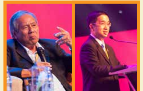
ประธานการจัดงาน (ชาย) และประธานคณะกรรมการฝ่ายวิชาการ (สาว) เปิดประเด็นการประชุม