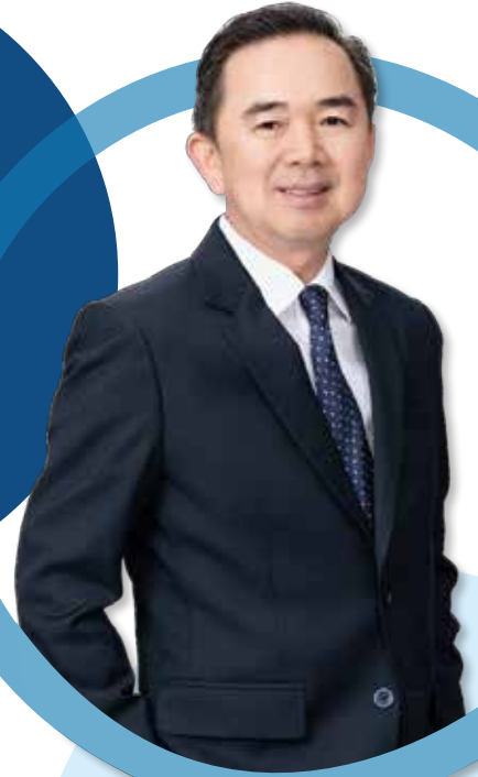
นายจักรกฤกษ์ พาราพันธกุล นายกสภาวิชาชีพบัญชี

สวัสดีปีใหม่สมาชิกทุกท่าน ผมมีความยินดีเป็นอย่างยิ่งที่ได้มากล่าวทักทายทุกท่าน ในวันเริ่มต้นศักราชใหม่ 2563 ซึ่งปีนี้ ตรงกับปีชวด หรือ ปีหนู นั่นเองครับ หนึ่งปีได้ผ่านพ้นและปีใหม่ก็ผ่านเข้ามา จึงขอโอกาสนี้ อวยพรให้ทุกท่าน ผมเจอแต่ความสุข สมหวัง คิดสิ่งใดขอให้ราบรื่นสมปรารถนา ทุกประการตามที่ตั้งใจ และคล่องแคล่วว่องไว ดังเช่นชื่อปีนักษัตรนั้นะครับ